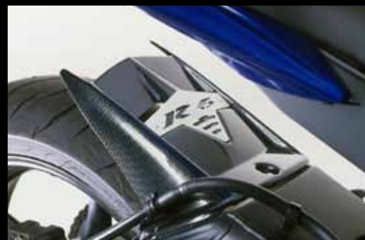
Hinterradabdeckungen und Schutzbleche Rear Hugger and Mudguards