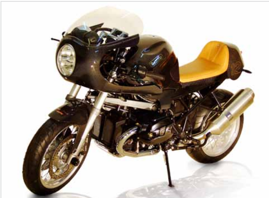
Perfektes Retro-Design von Horst Edler Perfect Retro-Design by Horst Edler