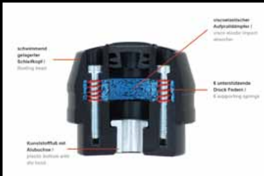
X-PAD Sturzpad X-PAD Crash Protectors