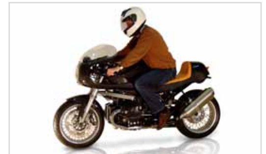
Bequeme Sitzposition Relaxed riding position