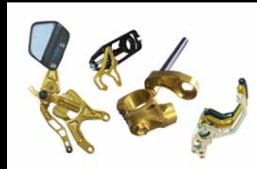
Gilles Tooling Produkte Gilles Tooling Products