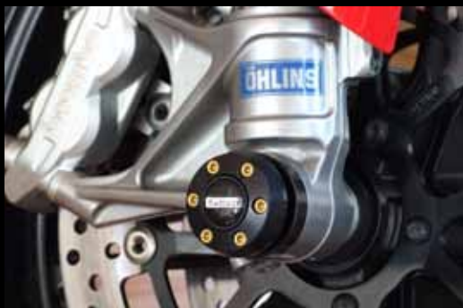
Gabel-und Schwingenschützer Fork- and Swingarm Protectors