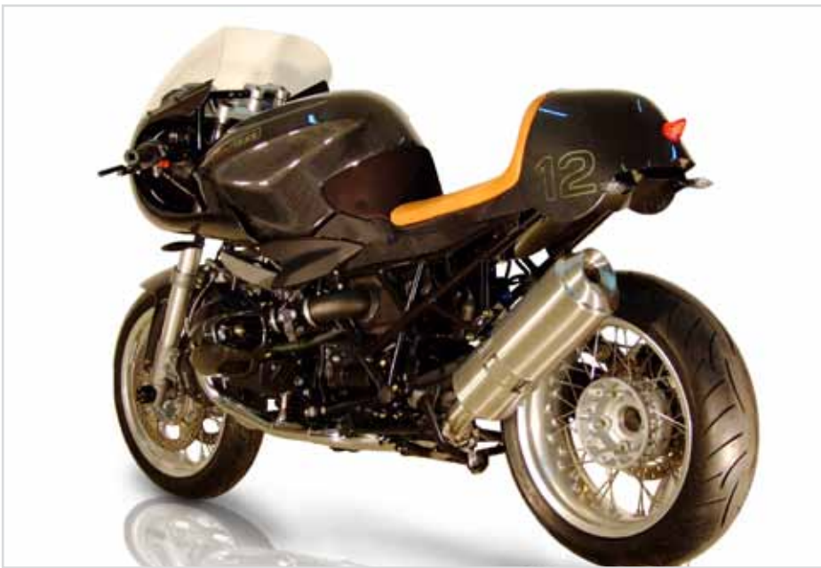
Dynamisch aus jeder Perspektive Dynamic look from each angle