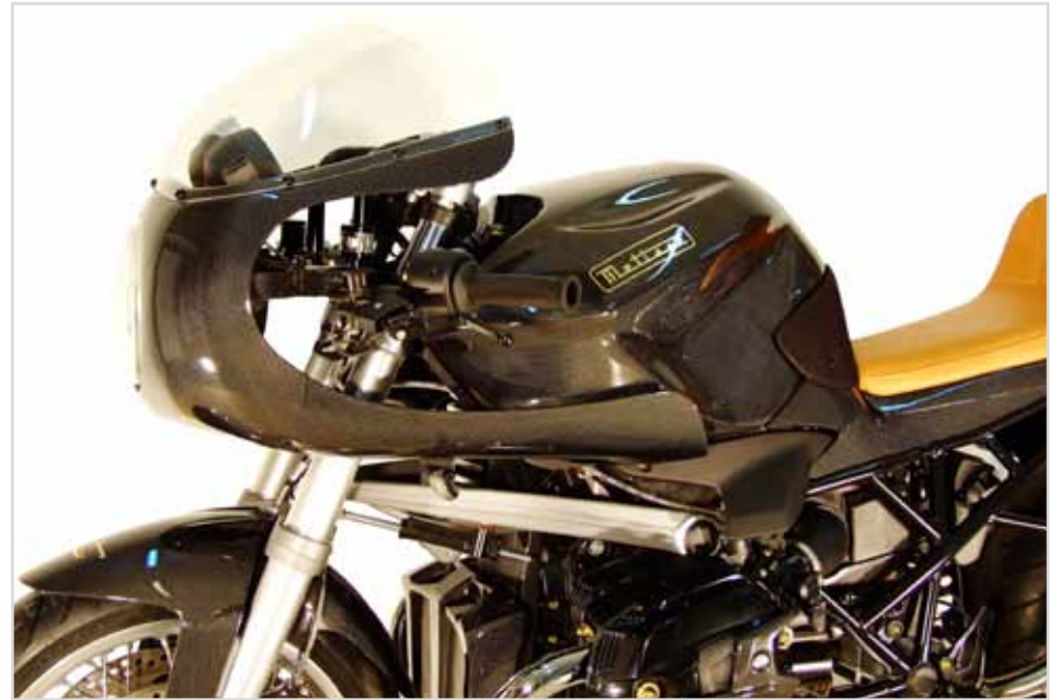
Leicht, stabil und wunderschön: Metisse Carbon Autoklaveteile Light, strong and beautiful: Metisse Carbon Autoklave Parts