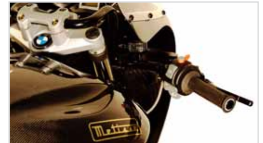
Ergo Sportlenker Ergo-Sport Handlebars