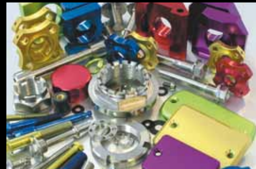
Pro-Bolt Schrauben und Fittings Pro-Bolt Fittings and Bolts