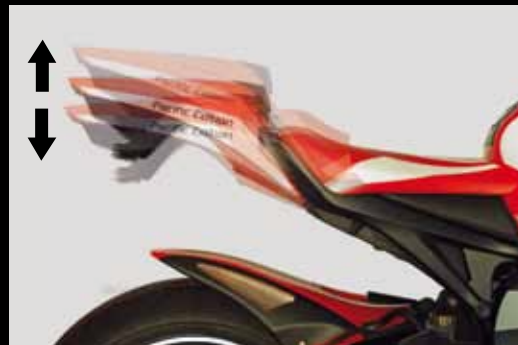
Tieferlegungen und Höherlegungen Lowering Kits and Tail Riser