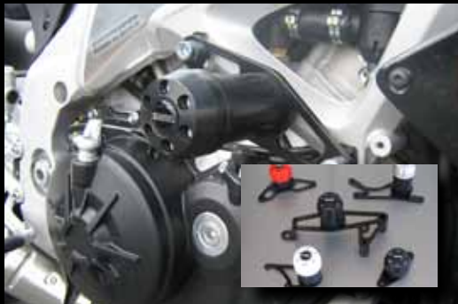
X-PAD Sturzpad X-PAD Crash Protectors