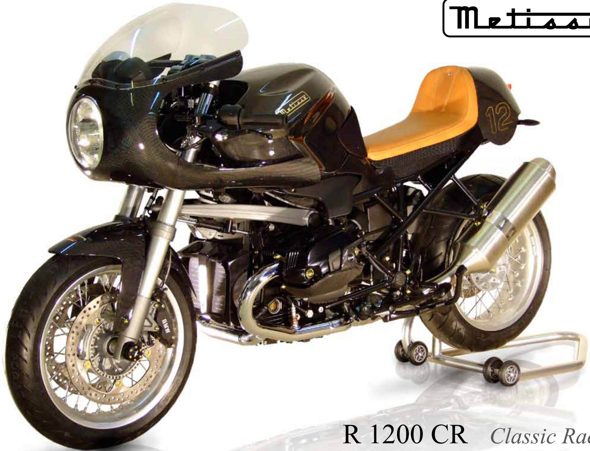
R 1200 CR Classic Racer