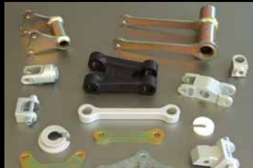
Tieferlegungen und Höherlegungen Lowering Kits and Tail Riser