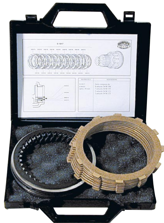
KIT FRIZIONE MODIFICATA PER DUCATI CON DISCHI SINTERIZZATI